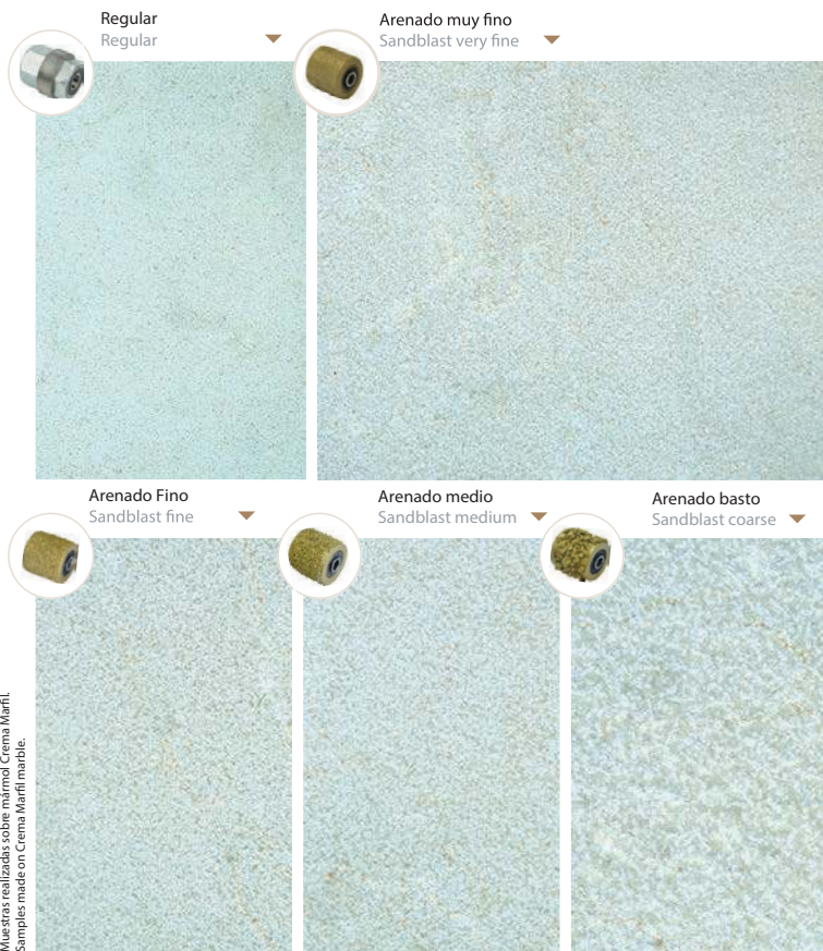
Muestras realizadas sobre mármol Crema Marfil. Samples made on Crema Marfil marble.

Universal fastening type Frankfurt, with quick coupling , adaptable to all machines on the market.